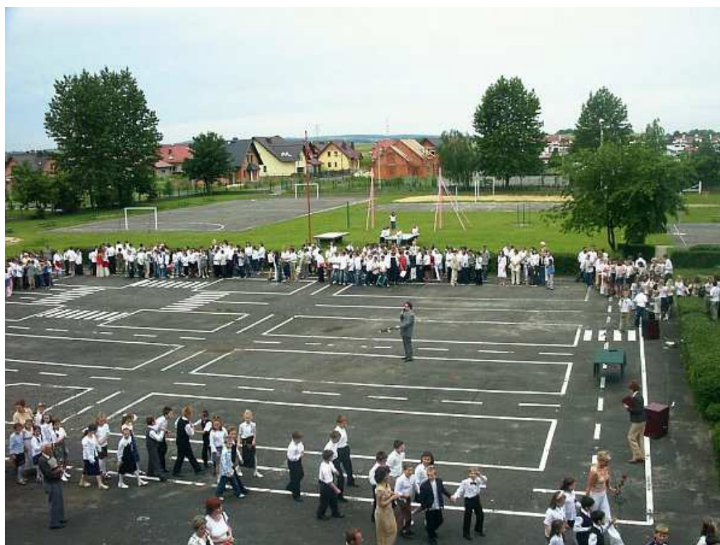
Na placu apelowym – zakończenie roku szkolnego