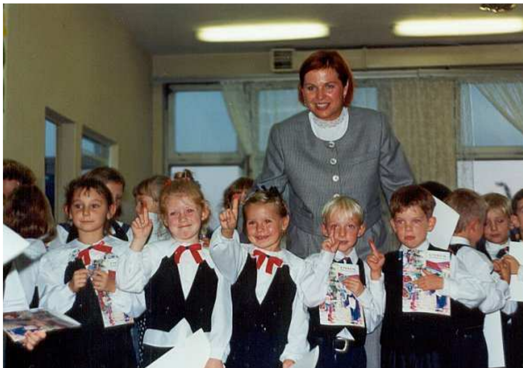
Ślubowanie klas I – rok szkolny 1997/98