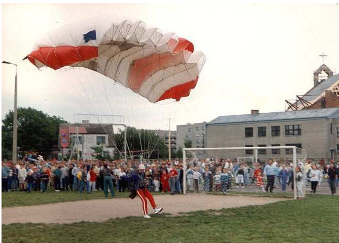
Podczas festynu – skoki na spadochronie - 1991