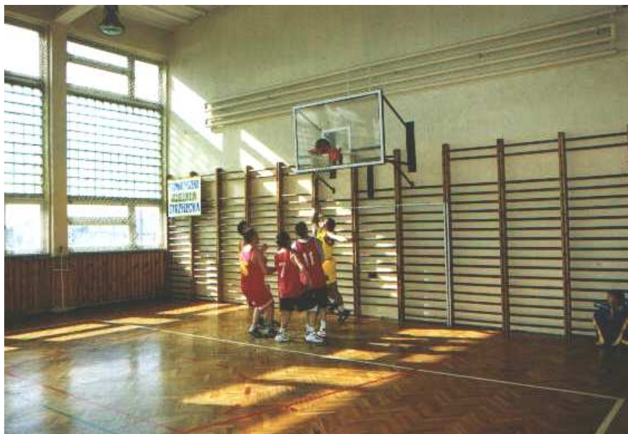
Podczas zawodów koszykówki