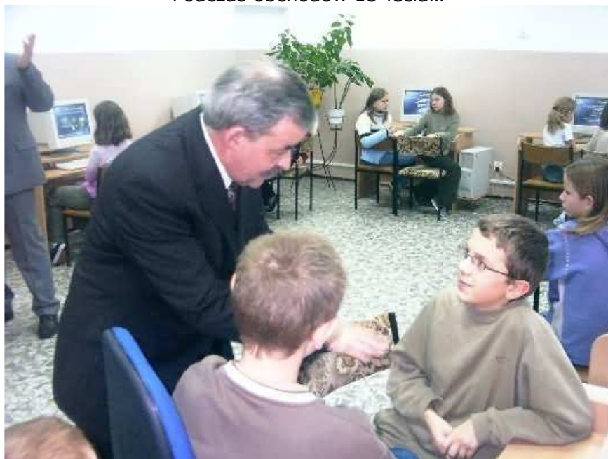
Otwarcie pracowni informatycznej