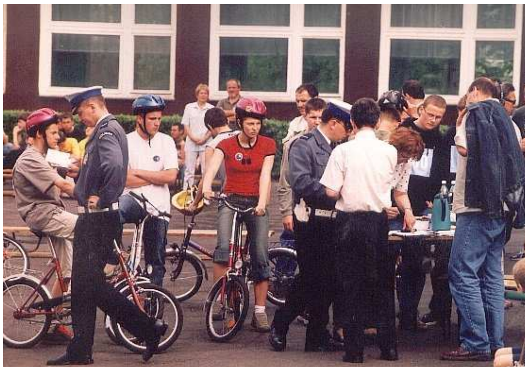
Wojewódzki Konkurs Bezpieczeństwa Ruchu Drogowego – 2003

IX miejsce w Indywidualnych Biegach Przełajowych - etap wojewódzki