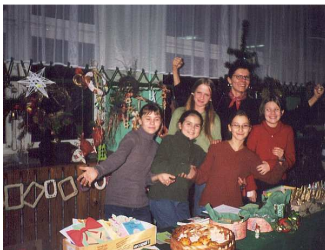
Podczas kiermaszu świątecznego