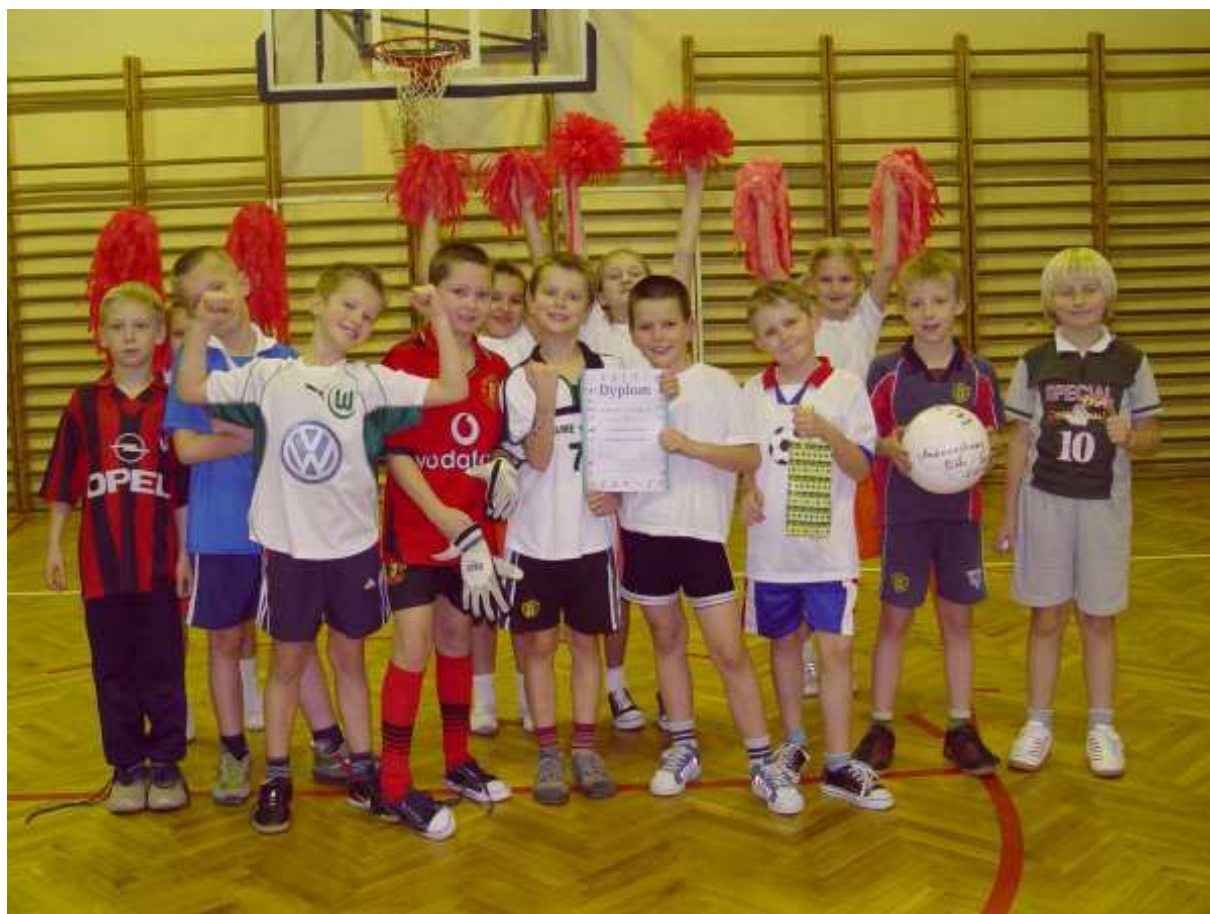
Podczas Turniej Piłki Nożnej klas I-III