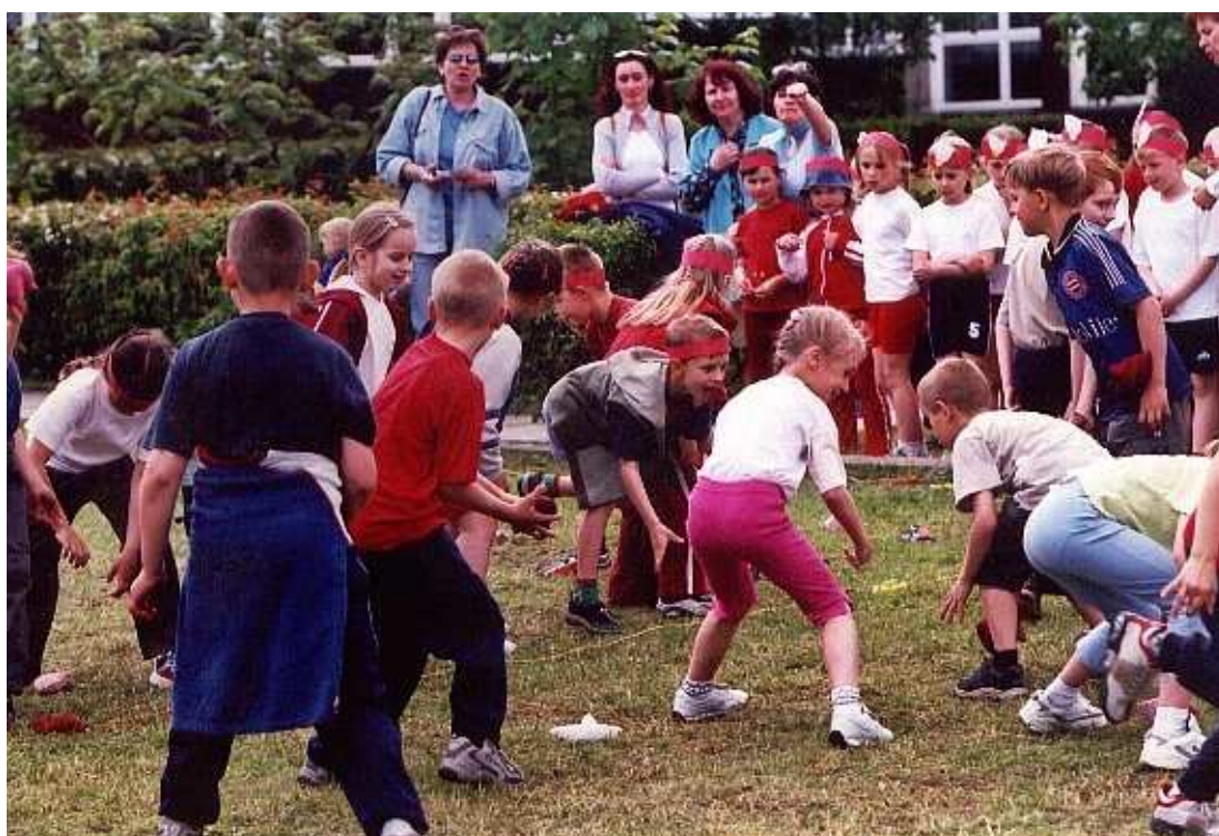
Dzień Dziecka 2004

Uczniowie klasy II i III szkoły Filialnej w Roźniątowie zajęli II miejsce w kategorii scenki w gwarze śląskiej.