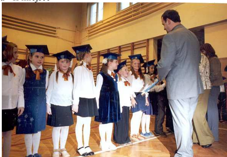
Pasowanie klas pierwszych - 2004