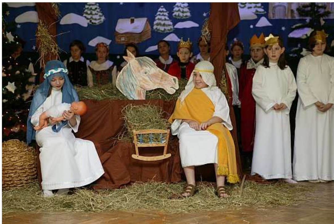
Podczas Jasełek – 2004