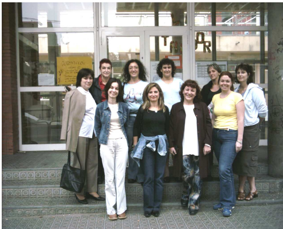
Na zjeździe koordynatorów – Barcelona 2005

Dzięki powyższym działaniom szkolny zespół koordynujący zyskał solidną bazę do sporządzenia wniosku o rozpoczęcie projektu, który został opracowany w grudniu 2005 r. i przesłany do AN w styczniu 2006 r. Obecnie wniosek poddany jest pracom AN i oczekuje na akceptację. Jej otrzymanie umożliwi realizację Projektu Hurray for Diversity! w latach 2006 – 2009.