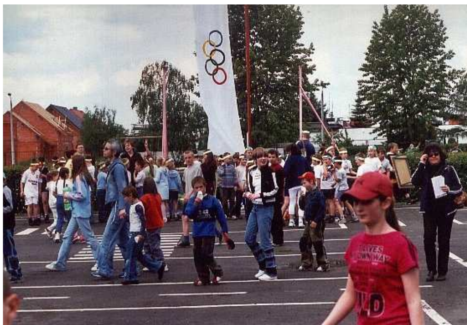
Dzień Sportu 2004

III miejsce w Wojewódzkiej Lidze Mini Koszykówki chłopców