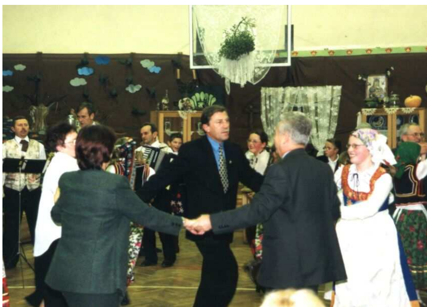
Obchody Roku Reymontowskiego – tańce