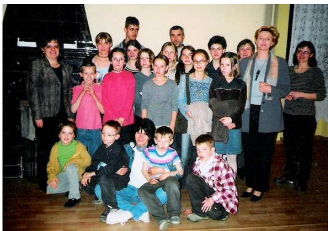
Z wizytą w Sowczycach