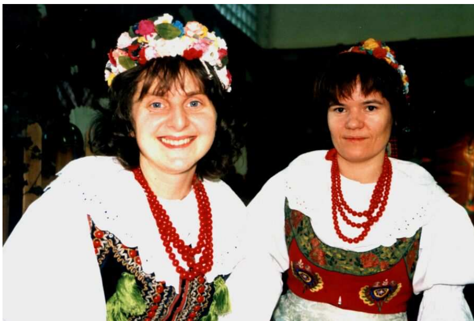
Obchody Roku Reymontowskiego – nauczycielki w strojach ludowych