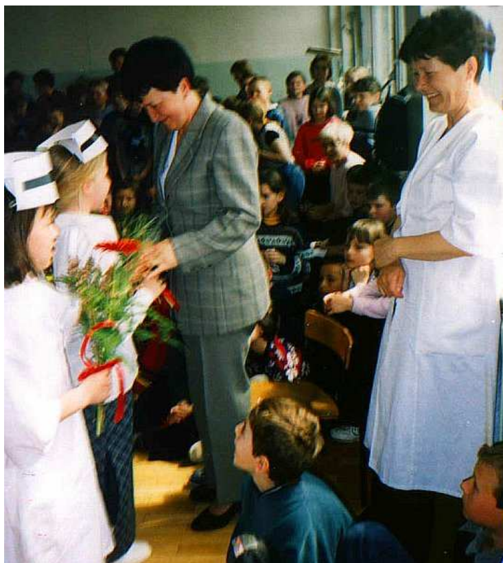
Pamiętamy również o służbie zdrowia...