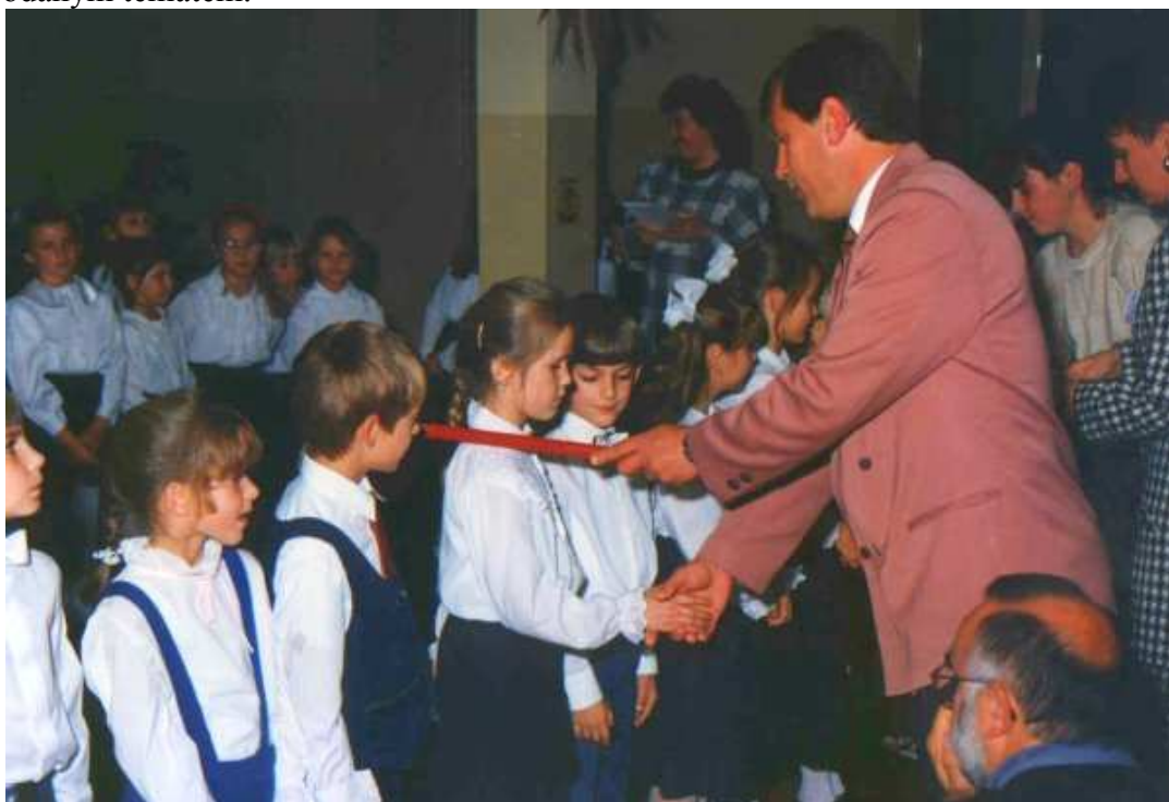
Pasowanie na ucznia - 1994