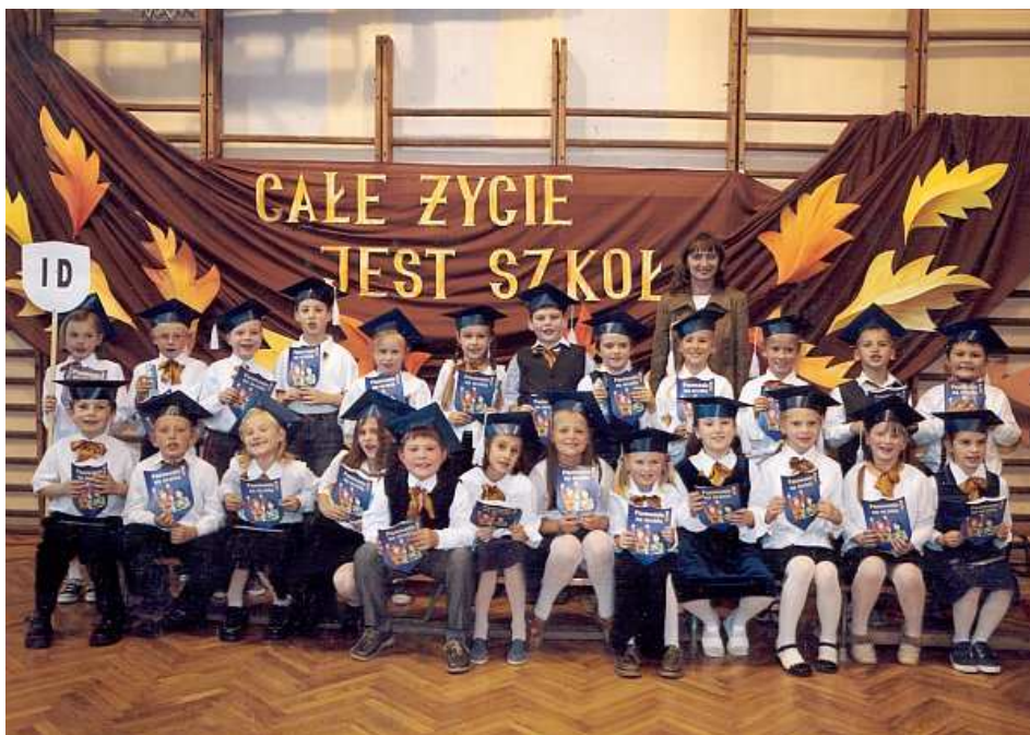
Klasa Id – rok szkolny 2004/2005