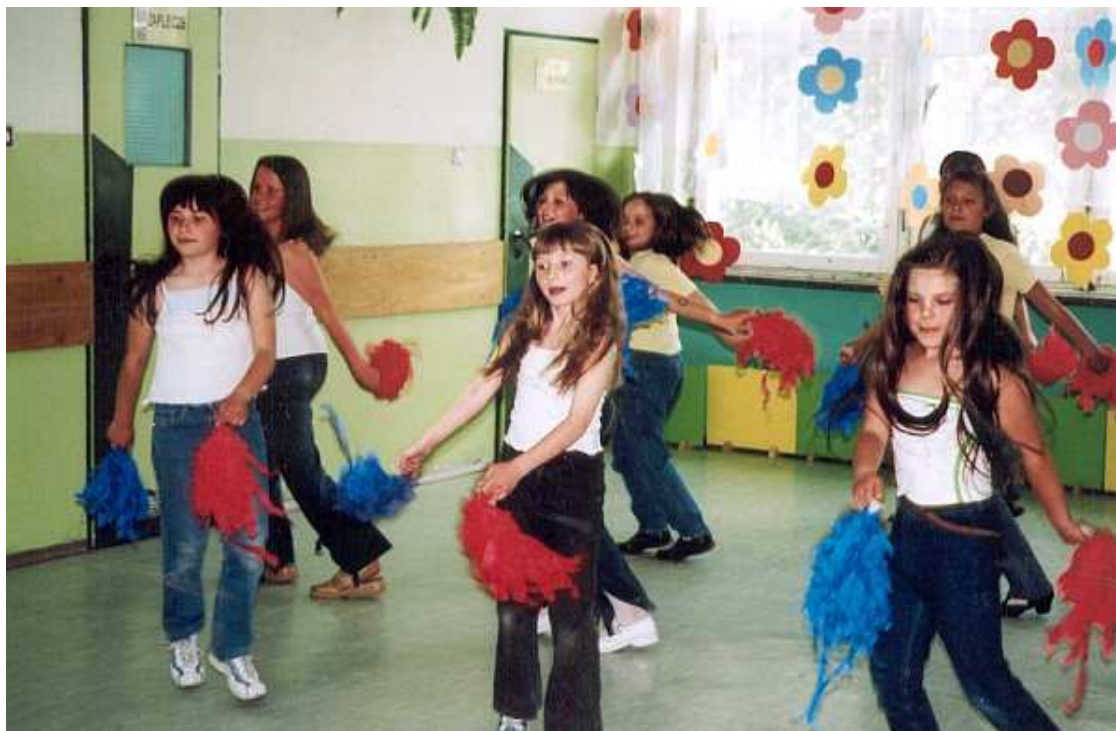
Zespół taneczny podczas próby